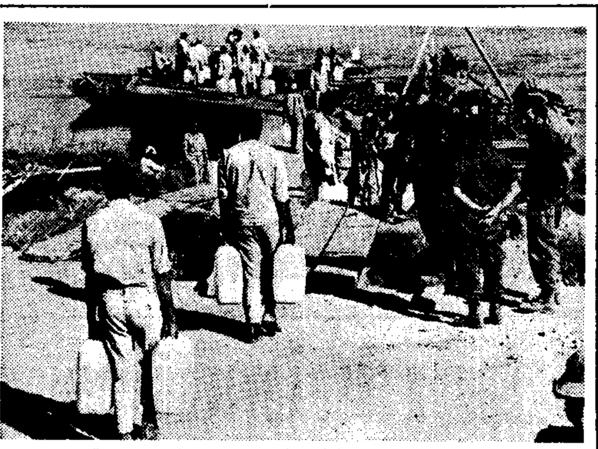
Στὴ βυτικὴ ἐστία τῆς Διοικήσεως τοῦ Σουλῆ, Ἀγύπτιοι στρατιῶτες μεταφέρουν κρέας ἐπὶ φορτηγῶν ἀπὸ τὴν Ἱερουσαλὴμ εἰς τὴν Ἀθήνησιν...